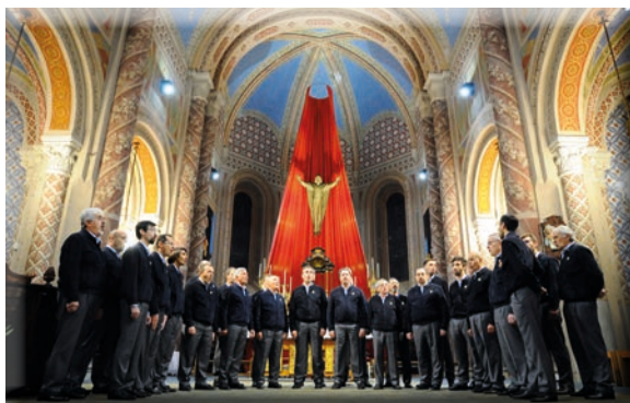
Chiesa di Castellamonte 2018

Pensiamo che sia la speranza di tutti, quella di tornare ad una vita pienamente normale, che ci piacerebbe poter allietare con le nostre voci, un po' arrugginite, ma sempre squillanti.