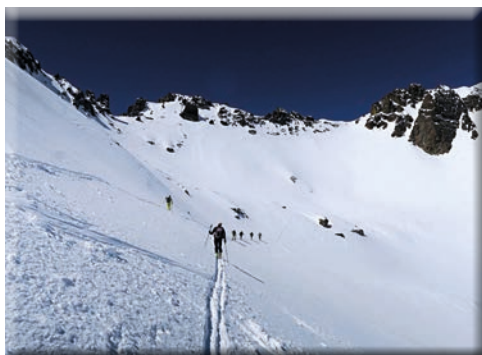
Vallone di Pontebernardo