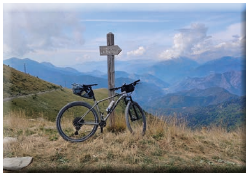
Lungo la Via del Sale

Scala Difficoltà: MC: Medi Ciclisti - BC: Bravi Ciclisti - OC: Ottimi Ciclisti