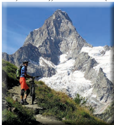
Le Grandes Jorasses - Val Ferret