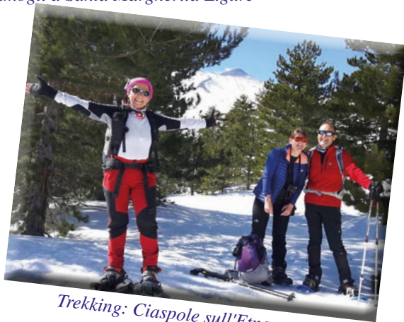
Trekking: Ciaspole sull'Etna