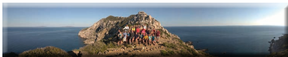
Punta Libeccio - Marettimo

Eventuali variazioni saranno tempestivamente comunicate attraverso la nostra newsletter.