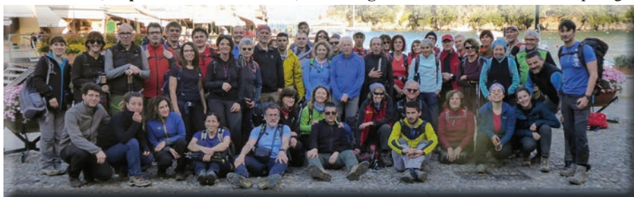
Da Camogli a Santa Margherita Ligure

Per informazioni scrivere a: commgite@caiuget.it o iscriversi alla newsletter dal sito Cai Uget “Escursionismo - Commissione Gite” - www.caiuget.it/cge/ Le gite della Commissione Gite sono elencate nelle sezioni “Escursionismo In Ambiente Innevato, Escursionismo, Alpinismo e vie Ferrate, Trekking”, a seconda della relativa tipologia.