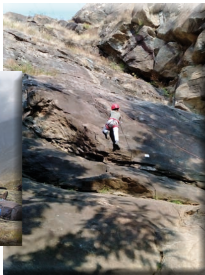
Prime esperienze d'arrampicata