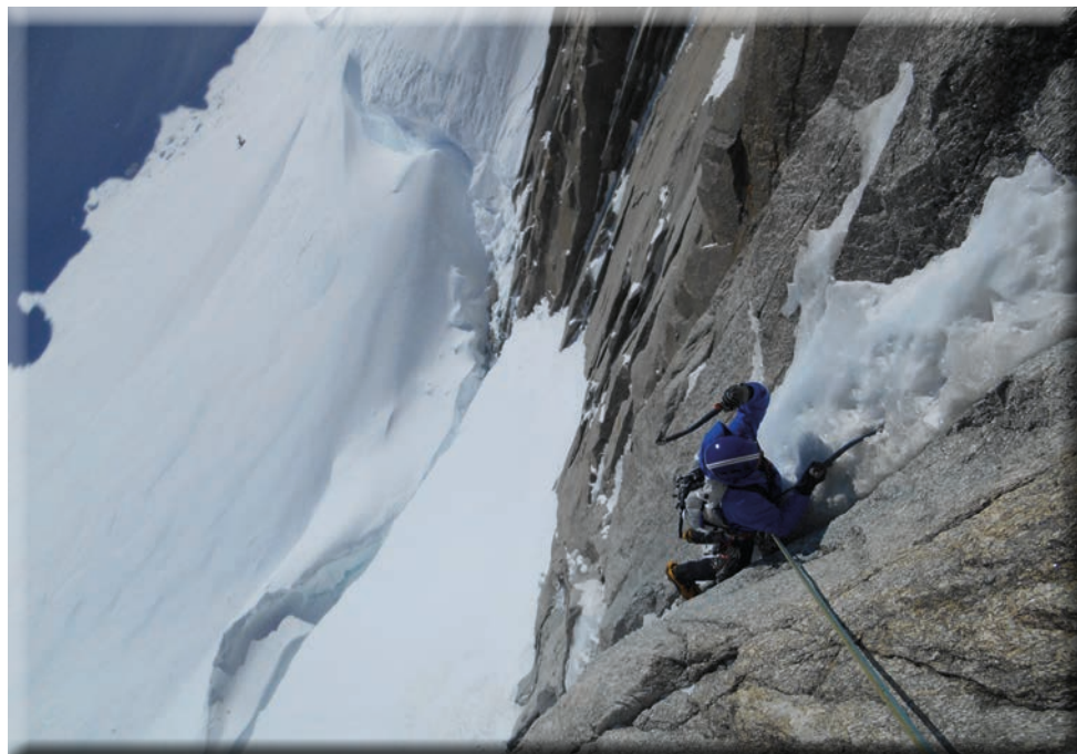
Scuola di Alpinismo "Alberto Grosso"