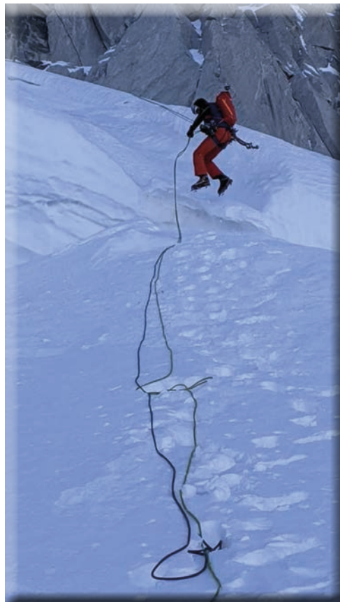
Tour Ronde - Via Gabarrou

Entrambe i percorsi prevedono lo svolgimento di lezioni teoriche in sede, lezioni pratiche presso palestre indoor e uscite in falesie in Piemonte, Valle d'Aosta e Liguria.