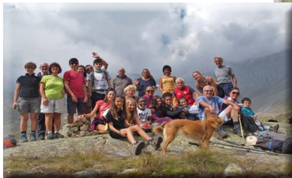
Anello attraverso il rifugio Pontese