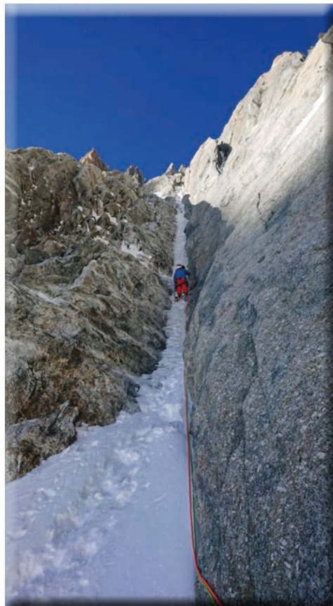
Filo di Arianna alla Combe Maudit