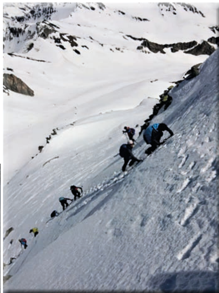
...verso la cima del Pain de Sucre