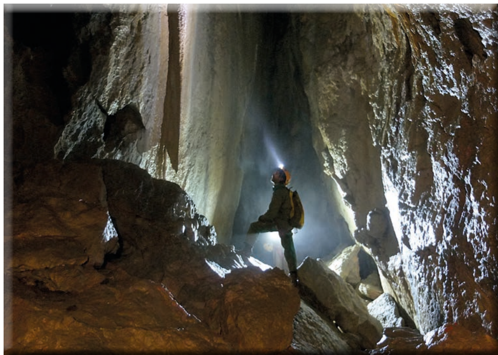
Gruppo Speleologico Piemontese