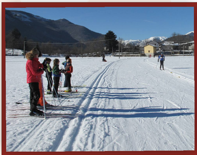
Festona Corso di fondo per bimbi

Le località prescelte per lo svolgimento dell'attività verranno raggiunte con mezzi propri.