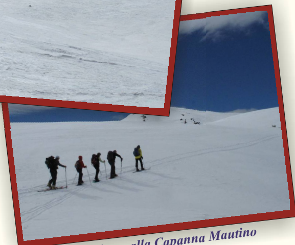
Sci Escursionismo alla Capanna Mautino