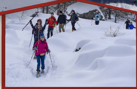
Nei pressi del rifugio Toesca